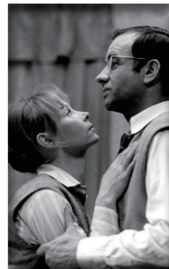
DER DRITTE The Third DDR/GDR 1971, colour, 111 min., dir. Egon Günther.

The story of a young teacher who goes against the routine opportunism of her hypocritical and small-minded surroundings. The young teacher tries to encourage open discussions about taboo topics in her classes. Her superiors view her actions with unease and eventually step in to discipline Karla.