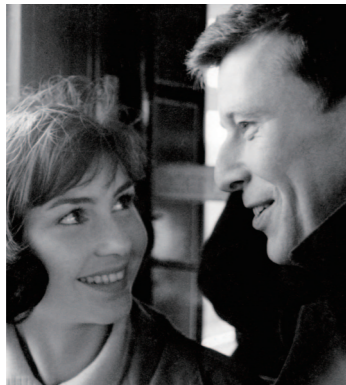
DER GETEILTE HIMMEL Divided Heaven, DDR/GDR 1964, 110 min., b/w, dir. Konrad Wolf.

DEFA was the central East German film production company closely supervised by the state. This retrospective will screen some of its most important films.