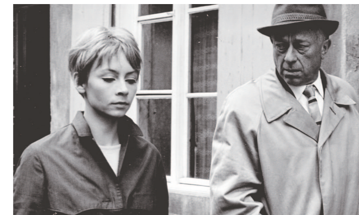
KARLA DDR/GDR 1965/1990, 129 min., b/w, dir. Herrmann Zschoche.

Most others in Linda's construction site team are men, so perhaps it is no wonder that she falls in love—not with one, but with two of them... Officials banned this debut film for what they considered its "unrealistic picture of East German life." It did not become widely available in Germany until 2010.