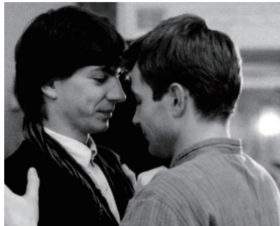
COMING OUT DDR/GDR 1989, 112 min., colour, dir. Heiner Carow.